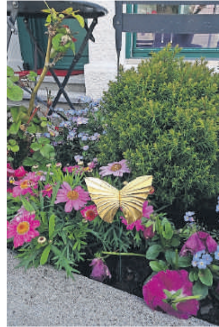
Blumen sind ein bevorzugter Aufenthaltsort der goldenen Wesen.