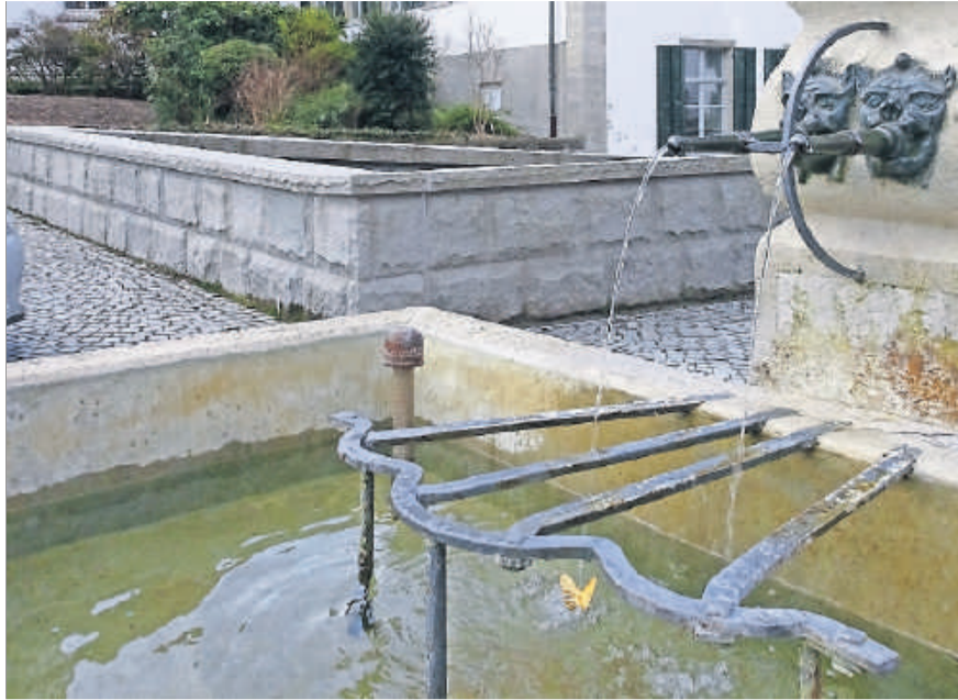
Die goldenen Schmetterlinge sind nicht einmal wasserscheu.

Es wird gemunkelt, dass auch in den kommenden zwei Wochen kleinere und grössere Sommervögel aus Goldfolie auf dem Küssnachter Gemeindegebiet anzutreffen sind. Dies kann überall der Fall sein – in karger Bahnhofsumgebung genauso wie im kühlen Nass oder in der Nähe von blühenden Pflanzen. Wer einen findet, wird gebeten, ihn mitzunehmen und ihm zu Hause oder anderswo ein schönes Plätzchen suchen. Oder aber an Ort und Stelle zu lassen, damit er noch andern Passanten ein Lächeln aufs Gesicht zaubert. (aj.)