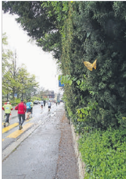
Auch am Marathon war einer dabei.