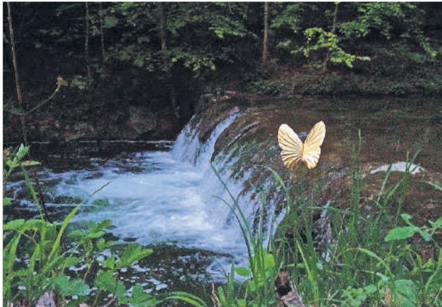
Sogar im Küssnachter Tobel scheinen sie verbreitet zu sein.